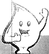
EDWIN RIVERA BALLESTERO Contratista