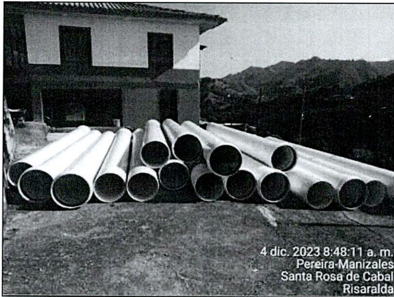
Fotografía 1. Acopio de tubería