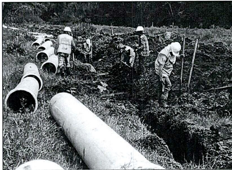
Fotografía 3. Instalación tubería