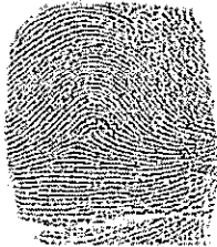
INDICE DE PUNTO