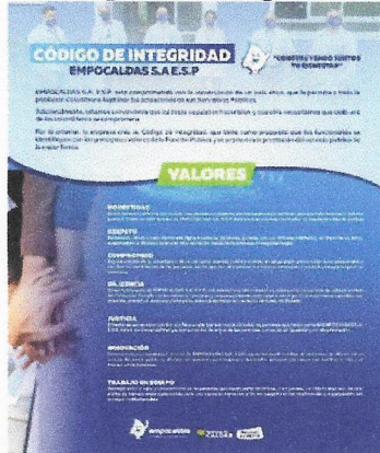
Nuevo diseño Código de Integridad.