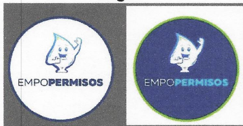
Diseño logo EMPOPERMISOS.