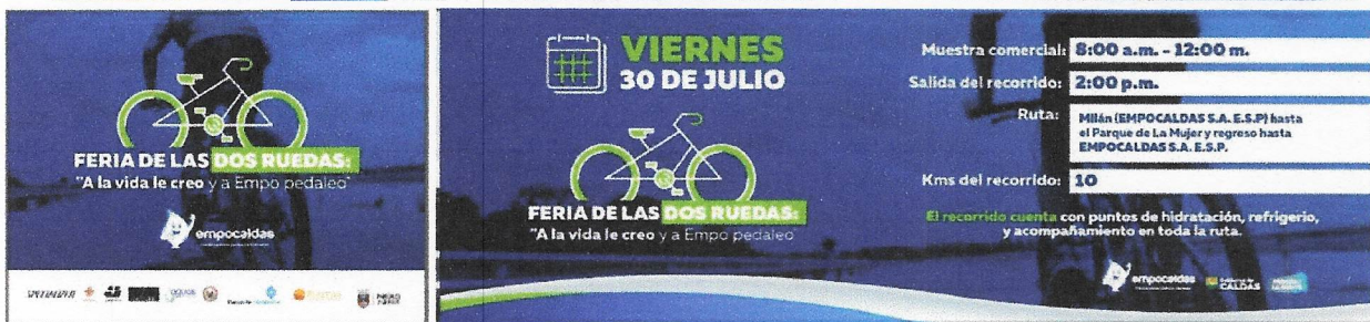
Diseño de tarjeta, programación, impreso, wallpaper y banner "A la vida le creo y por Emppo pedaleo".