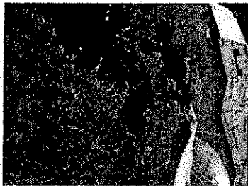
WhatsApp Image 2018-03-05 at 16.00.59.jpeg 305 KB