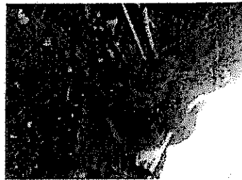
WhatsApp Image 2018-03-05 at 16.00.57-1.jpeg 166 KB