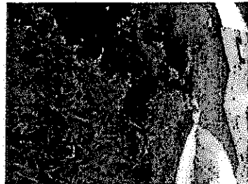
WhatsApp Image 2018-03-05 at 16.00.58-1.jpeg 309 KB