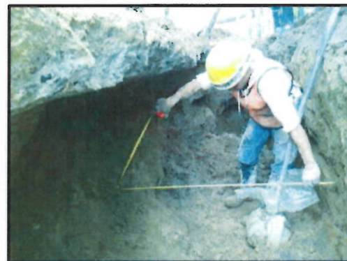
Fotografías No.16 No.17 y No. 18/ Instalación de tubería de 12", instalación de silletas, tubería de 6" para domiciliarias, evidencia de sobreechamientos en las excavaciones debido a derrumbes