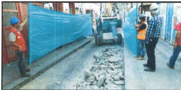
Fotografías No.1 y No. 2/ demolición de pavimento (e=0.20 mts)