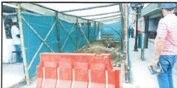
Fotografía No.3 / cerramiento y techado provisional.