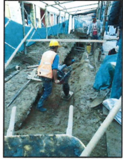
Fotografías No.13 No.14 y No. 15/ llenos con material de préstamo, sobreacarreo interno y compactación mecánica