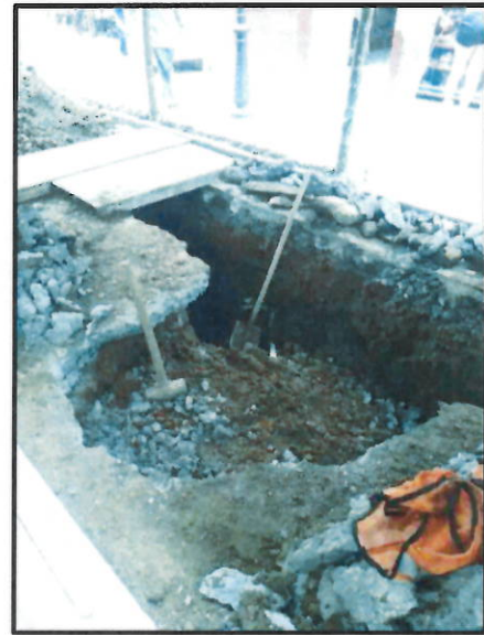
Fotografías No.4 No.5 y No. 6 / Excavaciones, cerramiento y techo provisional, demolición y excavaciones frente al cafecito para buscar tubería profunda existente