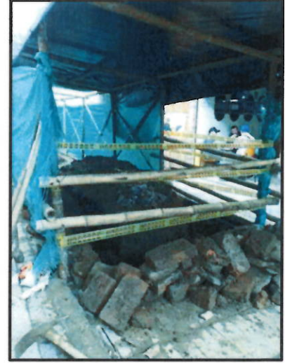
Fotografías No.10 No.11 y No. 12/ actividades de señalización en la obra