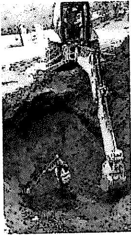
IMG-20180410-WA0008.jpg 155 KB