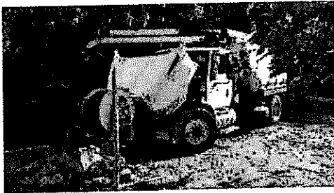
IMG-20180410-WA0009.jpg 129 KB