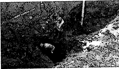
IMG-20180410-WA0014.jpg 165 KB