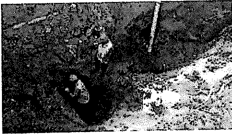
IMG-20180410-WA0013.jpg 165 KB