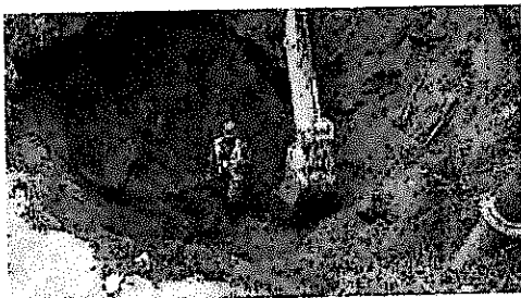
IMG-20180410-WA0011.jpg 153 KB