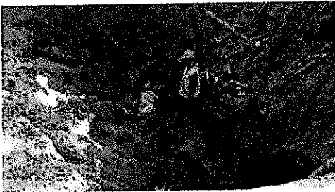
IMG-20180410-WA0015.jpg 156 KB