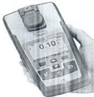
Turbidimetro 2100Q (1)