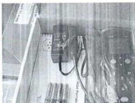
Multiparametros HQ40D (4)

De lo anterior anexo registro fotográfico.