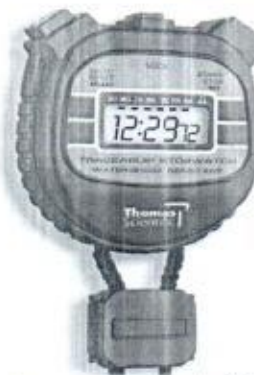
Cronometro digital (20)