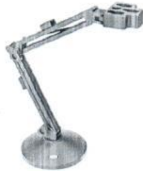
Soporte HQ40D (1)