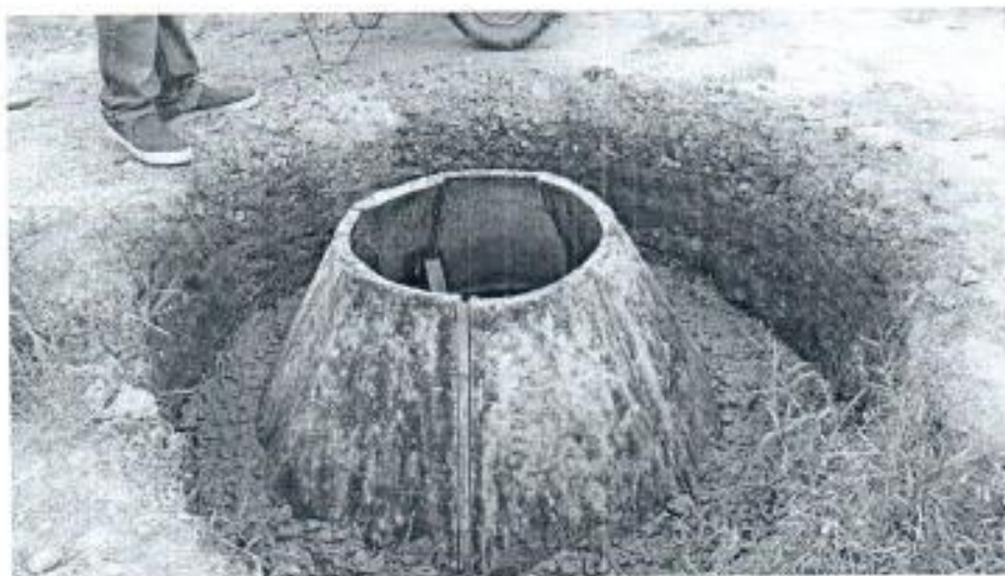
Bases y Cañuelas