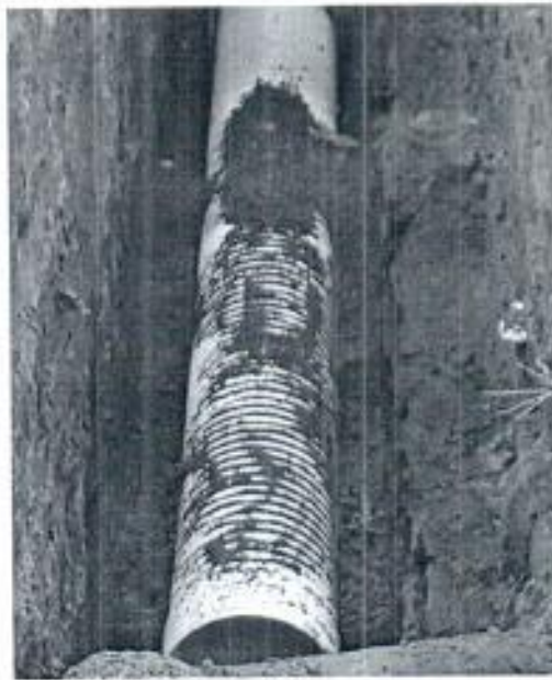
Lleno compactado con material de la obra