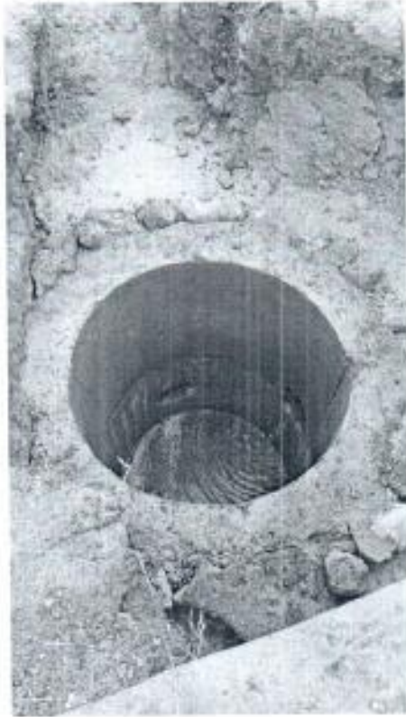
Arena para base y atraque