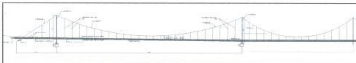
Figura 1.2. Aspecto general de los viaductos

Estos viaductos, estarán apoyados sobre sendos dados de concreto, de tal forma que garanticen la reacción de las columnas y de los cables propuestos