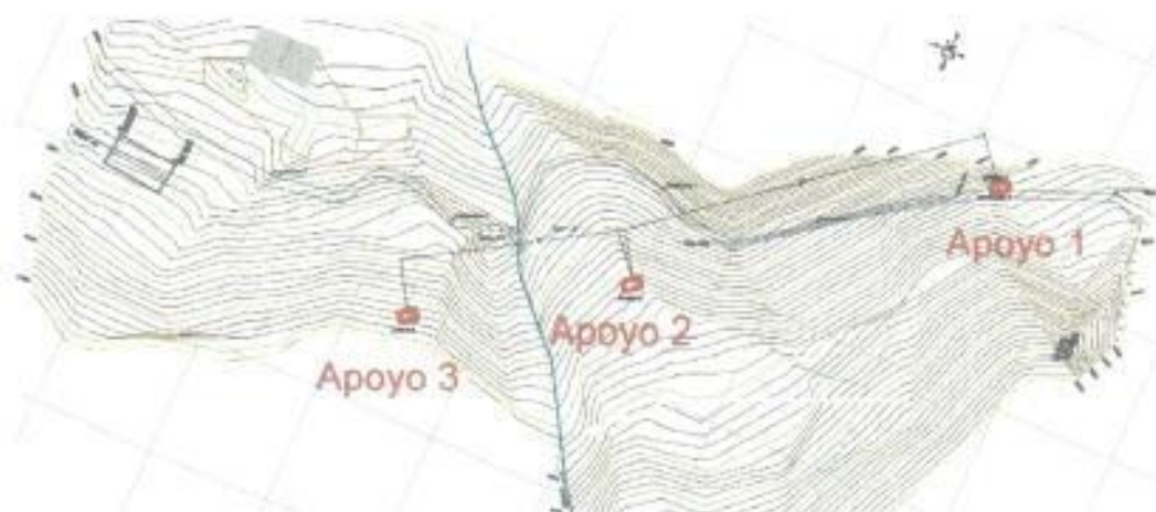
Figura 1.1. Localización general de los viaductos

Estos viaductos, estarán apoyados sobre sendos dados de concreto, de tal forma que garanticen la reacción de las columnas y de los cables propuestos