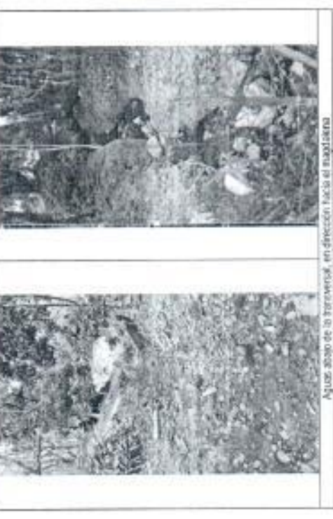
Agua abajo de la transversal, en dirección hacia el magnetron