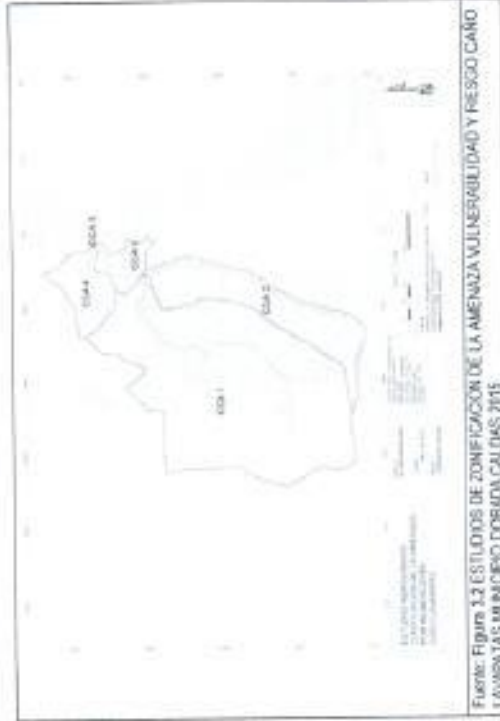
Fuente: Figura 3.2 ESTUDIOS DE ZONIFICACION DE LA AMENAZA VULNERABILIDAD Y RIESGO CAÑO LAVAPATAS MUNICIPIO DOBADA CALDAS 2015

La zona de estudio se ubica en el tramo final del caño Lavapatas en inmediaciones de la confluencia con el río Magdalena, la Figura 3.2 muestra en detalle la zona de estudio con sus respectivos cuadrantes de drenaje, la cuenca número 5 contiene las cuencas número 1, 2 y 3. Debido a que hidrológicamente los caudales deben ser calculados a este nivel.