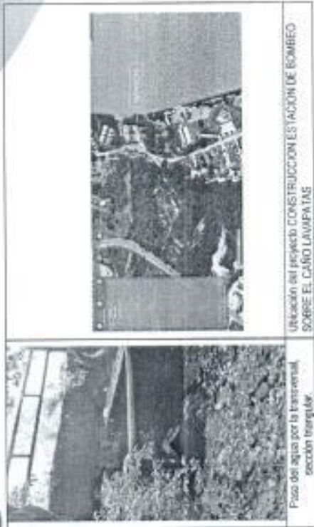
Pozo del agua por la transversal sección transversal.