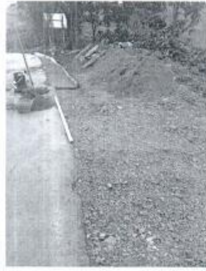
CONSTRUCCIÓN DE CUNETA SOBRE LA TUBERÍA PARA SU PROTECCIÓN