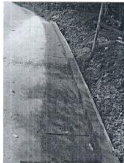
CONSTRUCCIÓN DE CUNETA SOBRE LA TUBERÍA PARA SU PROTECCIÓN