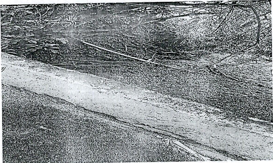
Tubería que requiere viaducto