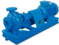
Misma bomba pero acoplada a motor con base y guarda

Espero su respuesta para saber cual seria la indicación a ofertar