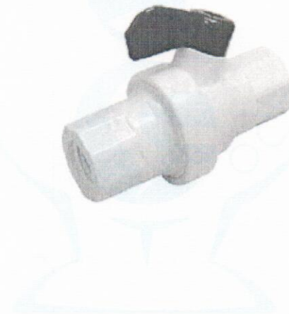
Imagen llave para jarra de jar test