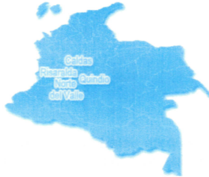
Presencia en el Eje Cafetero, Norte del Valle y atención a nivel nacional