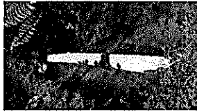
912333bf-3878-4f0a-9c29-779a5cdc2265.jpg 200 KB