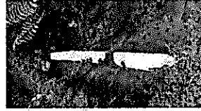
912333bf-3878-4f0b-9c29-779a5cdc2265.jpg 200 KB