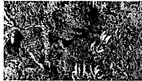
aea4b07d-62cb-4992-90c6-69c357c53428.jpg 279 KB