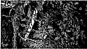
89912bc5-e86c-436d-ae94-0d324c654c5d.jpg 256 KB